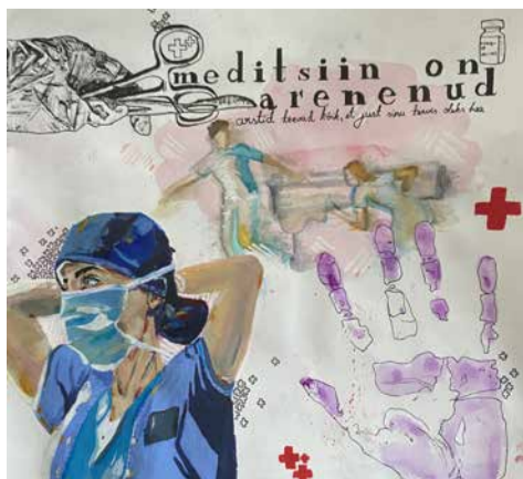
„Arstid ja meditsiin muutumas. Tänapäev“