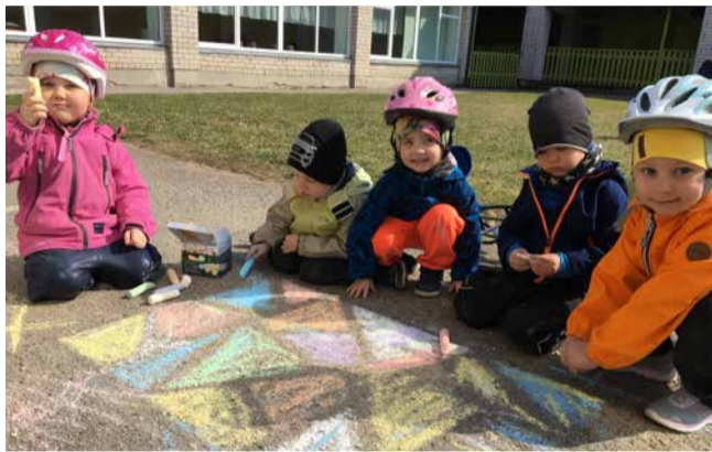
Riisipere lasteaia Pihlakate rühma võistlustöö