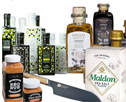
Maailmas enim hinnatud looduslikud meresoolahelbed, ühes aegade vanimas balsamiiko-farmis laagerdatud balsamiikid ning ilmselt parimad oliiviõlid maailmas.