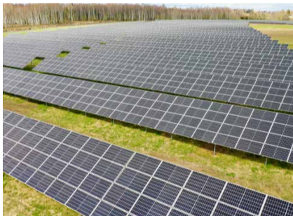
Võrtsjärve lähistel asuva päikesepargi koguvõimsus on 5,2MW.