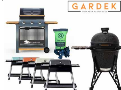
Maailma paremiku kuuluvate brändide parimad palad: gaasigrillid, pelletgrillid, kamaado grillid, suitsuahjusid