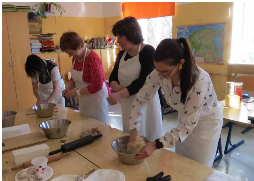
Turba Kooli õpetajad ÕPIVAD õpilase juhendamisel, kuidas pelmeene teha. See on omamoodi sümbolne, et kui me täiskasvanutena soovime hästi õpetada, siis peame usaldama ka õpilasi, et nendelt õppida.

vaatame ümber oma arengu eesmärgid ja tee nende ni. Rööprähklemise asemel tuleb kõrvale heita kõik võib-olla oluline ja keskenduda ainult kõige olulisemale - õpilase õpitulemuslikkusele. Selleks plaanime käivitada uuest õppeaastast oma koolis õpetajate õpikojad.