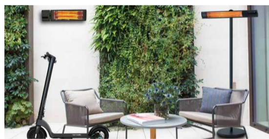
Lai valik infrapuna soojuskiirgureid, küttepaneelid ja gaasisoojendeid ning Velt Smart Scooter elektritõukerattaid.