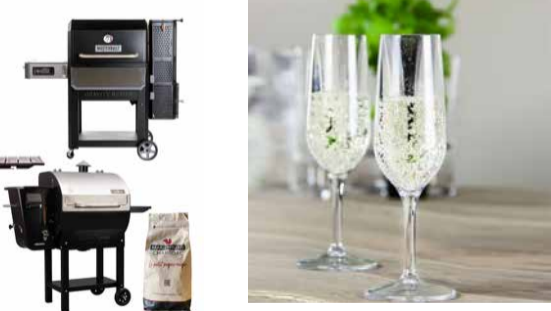
Purunematust bioplastist šampusepokaalid, veinipokaalid, lisaks õlleklaasid, kokteiliklaasid, joogiklaasid.