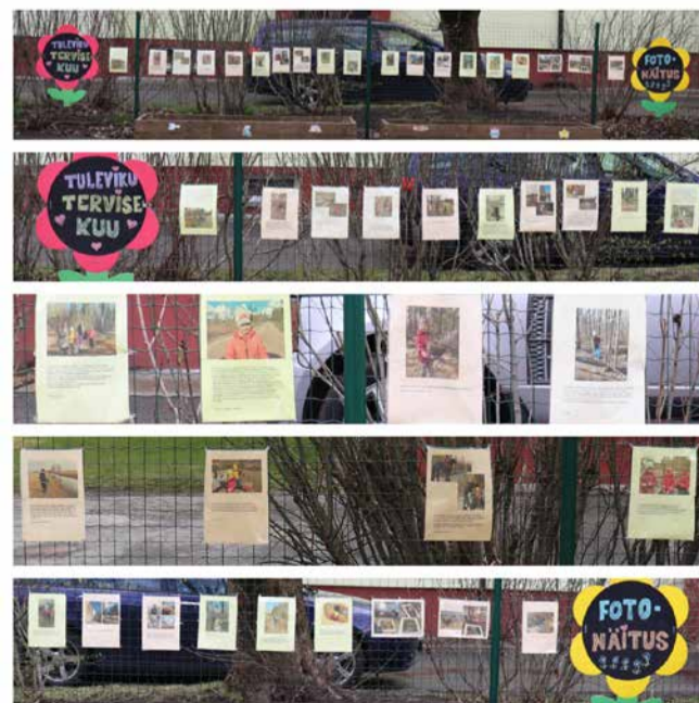
Kõik pered on oodatud Tuleviku Lasteaia õpiõue näitust külastama ja saama häid mõtteid uuteks matkasihtkohtadeks.

Tore oli lugeda ühe pere jalgrattamatka kirjeldust, kus vanemad tunnistasid, et tänu lasteaia üleskutsele tõid ka nemad oma rattad talvekorterist välja. Teine