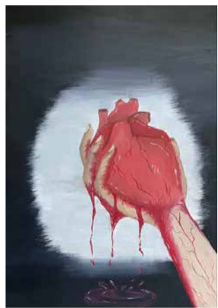
„Elu sinu peopesal“