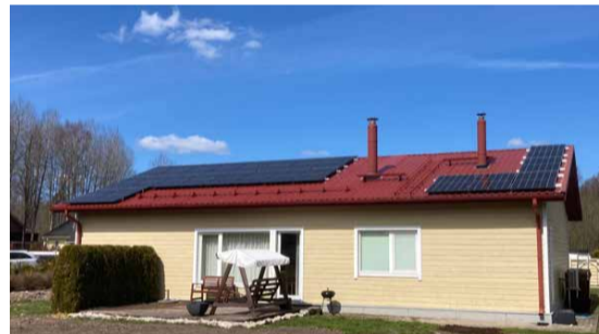
Sellest eramust Ääsmäel sai tänu pelletkütte väljavahetamisele maasoojuspumba ja päikesepaneelide vastu nullenergiama. Pererahvas kütte- ja elektriarvete pärast enam muretsema ei pea.

ka Rohetiigri programmi ja ettevõtte missioon on tegutseda energiasäästlikuma homse nimel, mistõttu usutakse firmas, et ka vana maja küttesüsteemiga tuleb tegeleda.